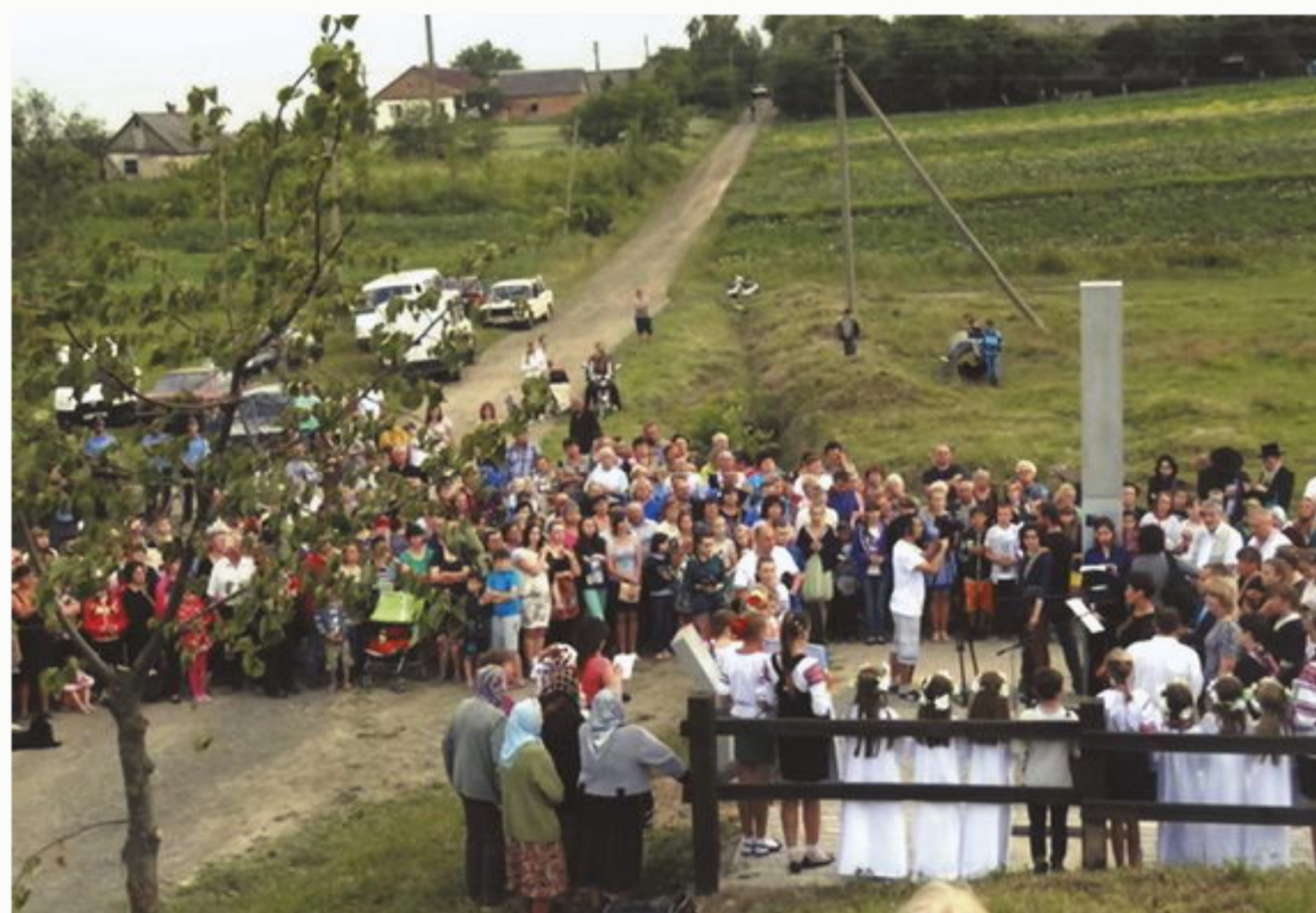
Открытие мемориала жертвам Холокоста в Острожке. 30 июля 2015

Эта история началась с двух постов в Фейсбуке на странице Эдуарда Долинского. 2 июня вице-президент Украинского еврейского комитета написал, что днем ранее государственная комиссия в Ровно, которая должна была одобрить надпись на мемориале погибшим евреям в с. Острожец, отказалась это сделать.